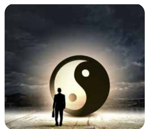
Продолжение в следующем выпуске

Был ученым или представителем местной власти, однако особых успехов достичь не удалось. Пребывал в счастливом браке. Удача будет сопутствовать в делах. Также добавляет оптимизма склонность к продуктивному труду и высокий интеллект.