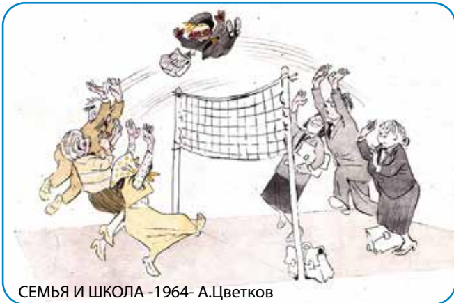
СЕМЬЯ И ШКОЛА -1964- А.Цветков

На вышеописанную процедуру утконос тратит как минимум 12 часов. Несмотря на скромные габариты, зверьки очень прожорливы — чтобы не помереть от голода, в день они съедают до 20% от собственного веса. Каждый день ловить по полкило червей — задача не из лёгких. Чтобы найти в себе силы плавать полдня, утконосы умеют разгонять обмен веществ в три раза (!). Правда, сам по себе обмен веществ у утконосов очень медленный — средняя температура тела не выше 32 °С. Это ещё одна приколюха древних лет, когда млекопитающие были частично-холоднокровными. То есть температура их тела могла меняться от температуры окружающей среды.