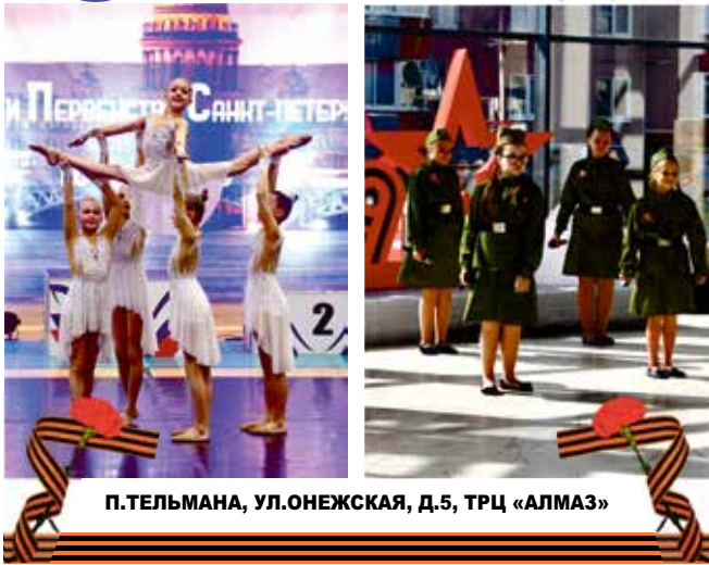
П.ТЕЛЬМАНА, УЛ.ОНЕЖСКАЯ, Д.5, ТРЦ «АЛМАЗ»