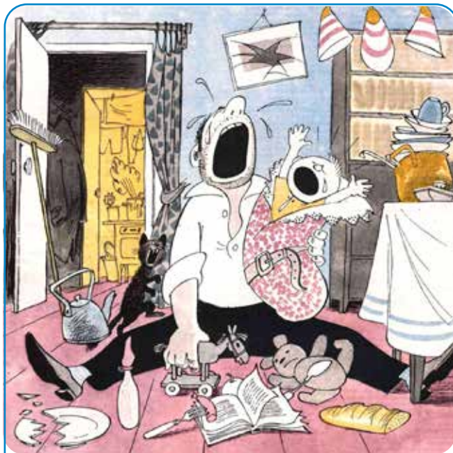
Жена задержалась на работе. Ма-а-ма! 1964 г. В. Чижиков

Но возможно, людям свойственны заблуждения?