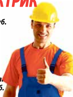
График 40 час.рабочая неделя. Зарботная плата 35 000 руб.

8(812) 452-53-24, 8(931) 535-12-15 г.Пушкин, ул.Новодедовская, д.19А