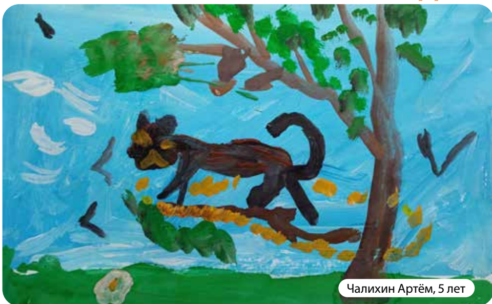
Чалихин Артём, 5 лет

Конкурс детского рисунка посвящен животным - братьям нашим меньшим.